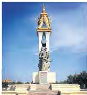
อนุสาวรีย์มีตรภาพกัมพูชา-เวียดนาม ณ กรุงพนมเปญ

เป็นที่แน่นอนแล้วว่าฮุนเซนกลายเป็นนายกฯ ที่ครองอำนาจนานที่สุดในโลกตอนนี้เขามีอำนาจมาแล้ว 33 ปี จะมีอำนาจต่อไปอีก 5 ปี ตามวาระรวมเป็น 38 ปี เขาเคยให้สัมภาษณ์ว่าจะเป็นนายกฯ อีก 10 ปี ซึ่งหมายความว่าชัยชนะครั้งนี้ทำให้เขาประสบความสำเร็จแล้วครั้งหนึ่ง