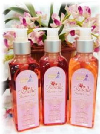
เจลอาบน้ำไลโปโซมกระเจี๊ยบแดง

เจลอาบน้ำที่มีส่วนผสมของสารสกัดกระเจี๊ยบแดงที่อยู่ในรูปของไลโปโซม มีฤทธิ์ต้านอนุมูลอิสระ ช่วยกระตุ้นการผลิตเซลล์ผิว ใช้ทำความสะอาดผิวหน้าและผิวกายเพื่อให้ผิวพรรณผ่องใสและช่วยลดการเกิดสิว